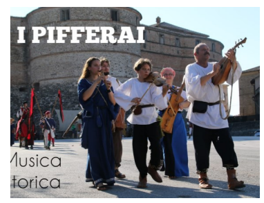
Musici e ballerini