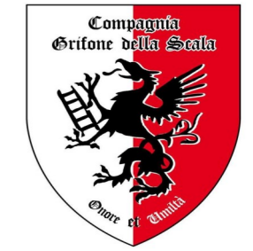
Compagnia d'armi del 1250

Quando cammine rete sul ponte, o viaggerete attorno al lago e visitate i campi con soldati, quando risalite la strada